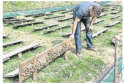
L'élevage ne compte que pour 2 % dans la production française.

Les quantités collectées sont en retrait de 30 % à 60 % par rapport à